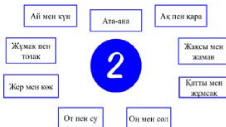
5-сурет. 2 санының ұлттық танымдағы көрінісі

9 саны – тоғыз ай, тоғыз күн, тоғыз ұпай, тоғызқұмалақ, тоғыз жолдың торабы ұғымдарымен байланыстырылған.