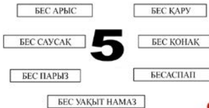
10-сурет. 5 санының ұлттық танымдағы көрінісі