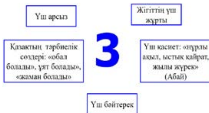
6-сурет. 3 санының ұлттық танымдағы көрінісі