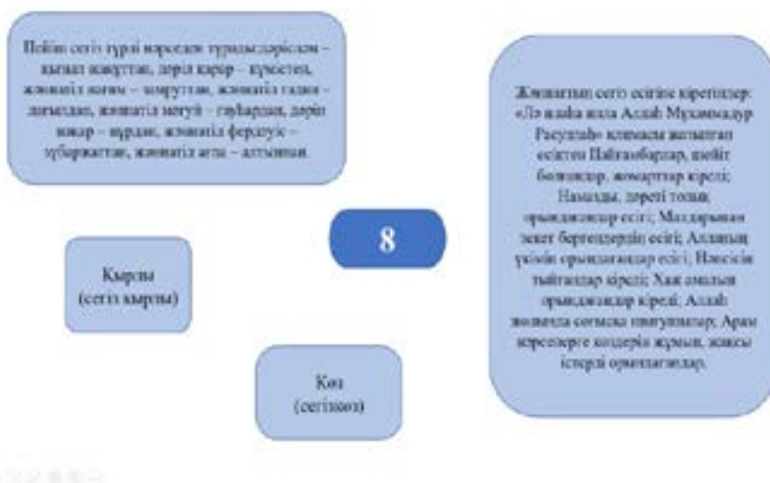
4-сурет. 8 санының ұлттық танымдағы көрінісі