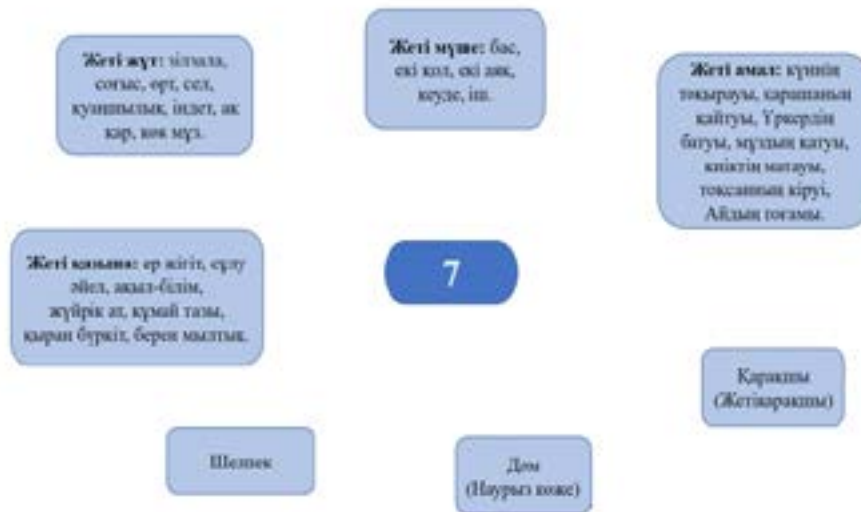
3-сурет. 7 санының ұлттық танымдағы көрінісі