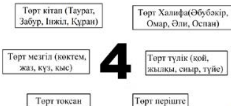
9-сурет. 4 санының ұлттық танымдағы көрінісі