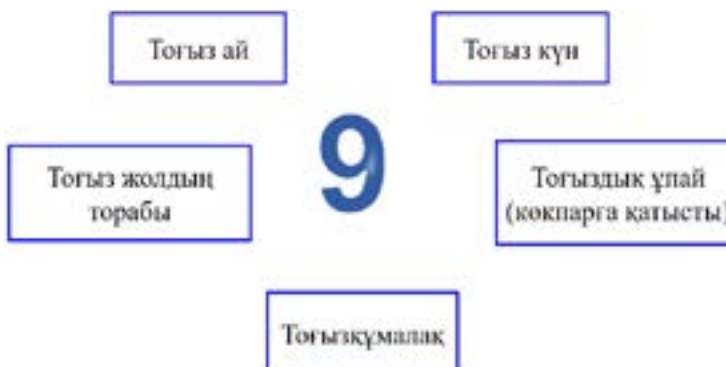
7-сурет. 9 санының ұлттық танымдағы көрінісі