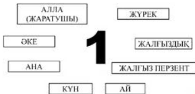
8-сурет. 1 санының ұлттық танымдағы көрінісі

5 саны – бес арыс, бес саусақ, бес қару, бесаспап, бес қонақ, бес парыз, бес уақыт намаз. Аталған топ оқушылары қазақы таныммен діни ұғымдарды да қамтығанын байқай аламыз. Бұл монотілді балалардың діни түсінікті қазақы таныммен сабақтастыра бойына сіңіргенін көрсетеді.