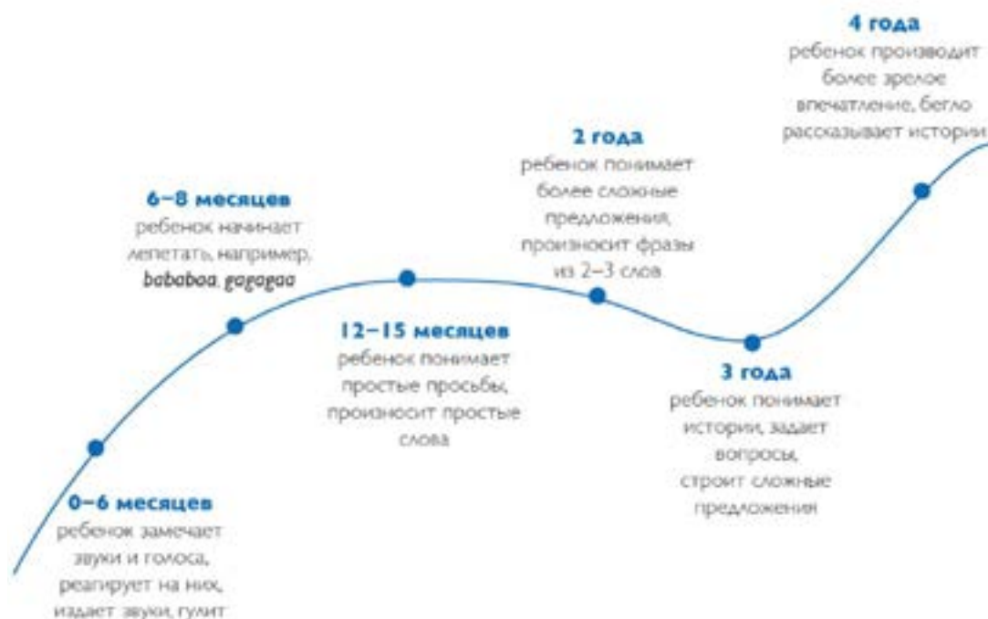
1-сурет. Бала сөйлеуінің дамуы